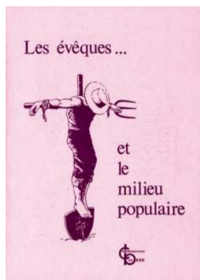
Rome ferme des Centres de formation comparables au Brésil. L'affinité du SCC avec eux va de soi, d'où cette affiche d'inspiration latino-américaine, contestée à sa sortie.

Marqué par l'ambiance des Golden Sixties, l'optimisme, la foi dans le progrès, ce Concile est considéré comme un des événements les plus importants de l'histoire de l'Église catholique du XX e siècle. Il exprime une autre conception de l'Église : elle est d'abord «peuple de Dieu», l'ensemble des femmes et des hommes croyants. Il rappelle que prêtres, évêques et pape sont des «ministres» à son service.