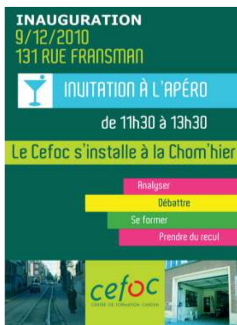
L'ancrage dans les quartiers populaires est important pour le Cefoc. Ici, une invitation pour l'ouverture d'un nouveau local à Laeken en 2010.

Les décisions mûrissent progressivement. Il s'agit de «vivre la nouvelle situation d'une existence instable, comme tous ceux qui font un travail du même genre et avec les mêmes options. Le Cefoc se retrouve en fait – suite à cette réduction drastique – à sa place : aux «marges» !»