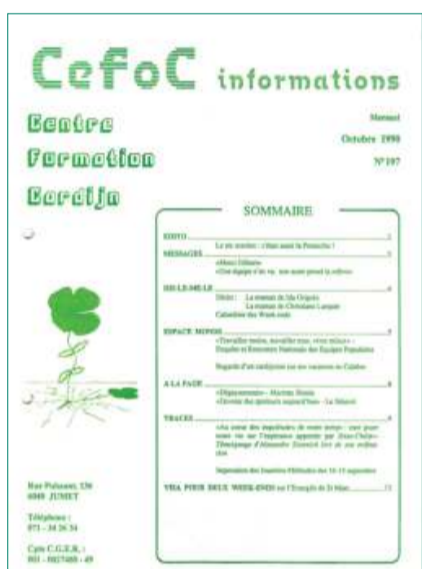
Octobre 1990, premier numéro du Cefoc Info. D'abord mensuelle, la revue devient trimestrielle en 1996. Durant les premières années, elle se fait surtout l'écho de la vie des groupes de formation.

Les décisions mûrissent progressivement. Il s'agit de «vivre la nouvelle situation d'une existence instable, comme tous ceux qui font un travail du même genre et avec les mêmes options. Le Cefoc se retrouve en fait – suite à cette réduction drastique – à sa place : aux «marges» !»