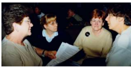
Discussion en «carrefour» lors du WEG de juin 1999 : de nouvelles orientations sont prises pour l'avenir.