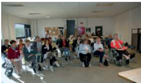
Journée à Herve, 2009.

Une autre constante traverse l'expérience du Cefoc : ouvrir les formations aux milieux populaires, qui sont en évolution permanente. Ainsi, à côté de son travail dans les quartiers, les cités, le Cefoc propose des formations dans des associations d'insertion socio-professionnelle, en prison, dans des maisons de quartier, pour des personnes handicapées et leur entourage, pour des acteurs sociaux qui s'adressent à des publics plus marginalisés. Il en découle aujourd'hui une grande diversité de thématiques abordées par les groupes, telles que : «Éduquer en situation d'immigration», «Regards croisés sur l'actualité», «Prendre sa place», «Les fins de vie, le deuil», «La place des convictions, en débat ou au vestiaire ?», etc.