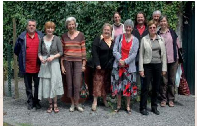
Autonomie et solidarité

Des anciens et des nouveaux membres de l'EC en 2008.