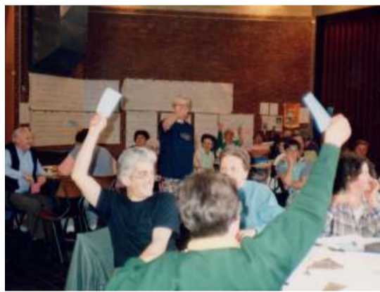
Prise de décision lors du WEG de juin 1992.