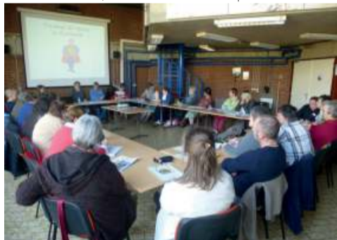
Lors du week-end 2013, l'assemblée débat sur l'identité professionnelle.

Par la publication de brochures et de courts textes d'analyse, le Cefoc répercute les préoccupations des participants. Outils pour les formations, ils permettent aussi au Cefoc de faire valoir son point de vue au sein de l'espace public sur des enjeux de société et de jouer son rôle d'acteur.