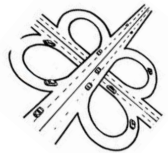
Afin de libérer la parole et d'éviter que certains ne la monopolisent trop souvent, des carrefours libres remplacent, dès 1991 les assemblées plénières.