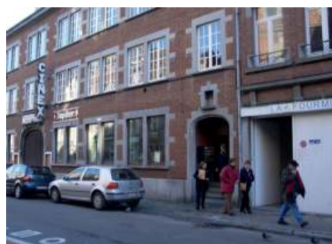
Le Cefoc reprend les locaux que le séminaire avait choisis, dans le quartier St Nicolas à Namur. L'implantation des sièges est révélatrice du choix des marges, qui se manifeste de bien d'autres façons.