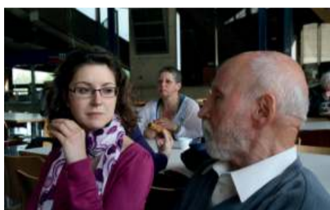
Week-end de formation portant sur la thématique de la fracture entre flamands et wallons, 2011.