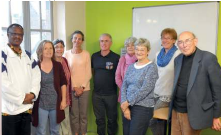
Chercher à se libérer

L'EC joue un rôle dans l'engagement et l'évaluation des permanents. Ici, l'EC entrée en fonction en 2015.