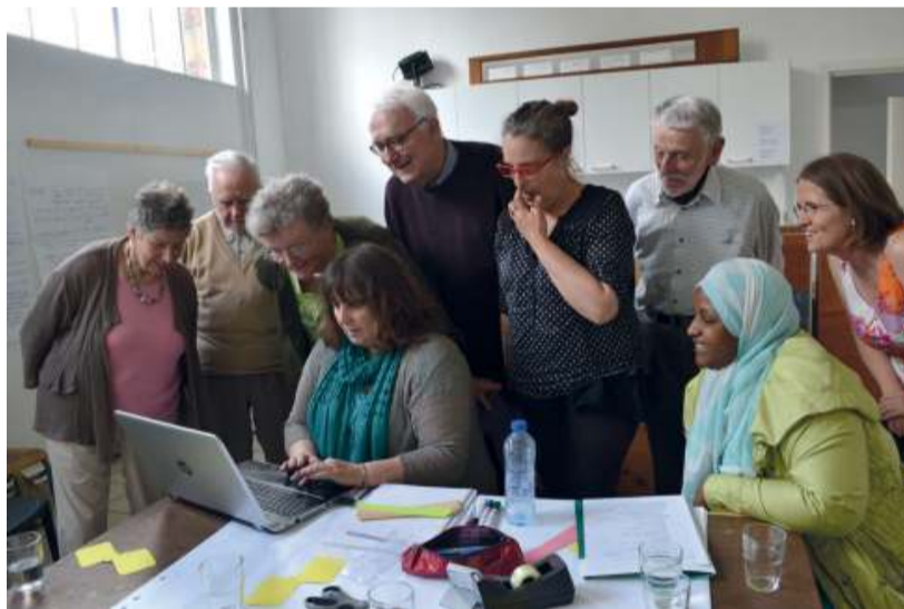
Journée régionale à Bruxelles, mai 2015, sur le thème : prendre sa place dans la cité.

Affiches de week-ends de formation organisés en 2013 et 2014. Elles reflètent une partie du large éventail des thématiques explorées par le Cefoc.