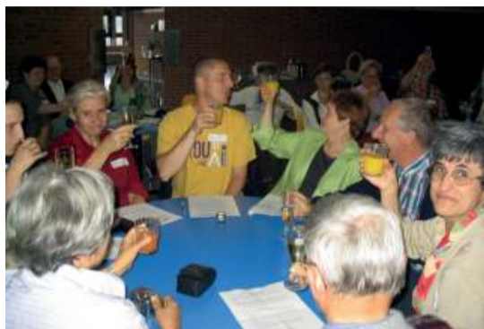
WEG «sujet-acteur» en 2005. On fête ça ! La convivialité a une place importante au Cefoc.