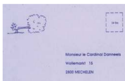
Le Cefoc cherche du soutien. Il fait imprimer 10.000 cartes que des sympathisants peuvent adresser au Cardinal Danneels, afin de l'interpeller à propos de l'avenir des 600 laïcs en formation.

La formation théologique s'élabore à partir des exclus comme le font des théologiens en Europe et la théologie de la Libération en Amérique Latine. Les communautés de base de divers pays sont aussi une source d'inspiration. Le but est commun : contribuer à une société plus juste.